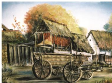
Stipan Kovač Malanka - "Zadnje dvorište u Monoštoru", ulje na platnu Naslovna strana - Stipan Kovač Malanka - "U Gornjem Podunavlju", ulje na platnu